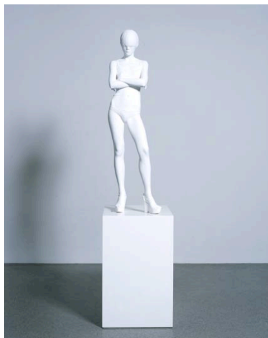
Yoko XIV, 2006, acrylic composite & acrylic paint, 118 x 32 x 27 cm, edition of six, copyright Don Brown, courtesy Sadie Coles HQ London.

« Don Brown s'est tout d'abord choisi lui-même comme le modèle de ses sculptures. Invariablement intitulées « Don », elles firent l'objet de sa première exposition personnelle chez Sadie Coles en 1997 et déjà étaient de moitié plus petite que nature. Don s'y représentait dans sa banalité parfaitement non-héroïque d'un homme du XXe siècle, loin des modèles triomphants de la statuaire antique qu'on a parfois convoqué à son sujet. Puis il a entrepris, il y a presque dix ans, de ne plus représenter que son épouse. Comme les sculptures dont il était le sujet, celle consacrées à Yoko sont plus petites que le sujet lui-même, de moitié ou de trois quart. L'effet est immédiat : on a envie de protéger ces figurines que l'on toise, et qui semblent comme pétrifiées dans la blancheur immaculée qu'elles arborent généralement — celle d'une fine résine acrylique, qui restitue à la perfection la précision maniaque avec laquelle elles sont sculptées. Car comme le laisse percevoir leur petite taille, elles ne peuvent avoir été moulées sur l'original, et ne peuvent donc être que le fruit d'un patient travail : en cela encore réside leur singularité dans le paysage manufacturé de l'art de notre époque. » (Extrait d'un article d'Eric Troncy publié dans Numéro, n°78, novembre 2006)